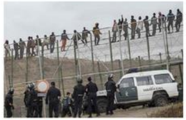
6. Spagna confine con la Marocco (Ceuta e Melilla) 8 km + 12 km