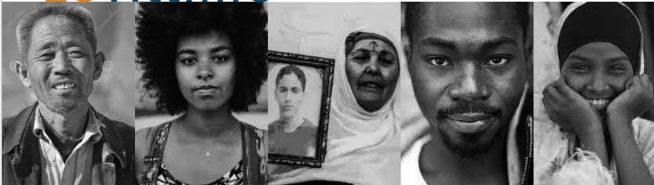
Nome Cognome migrante dal Sudan