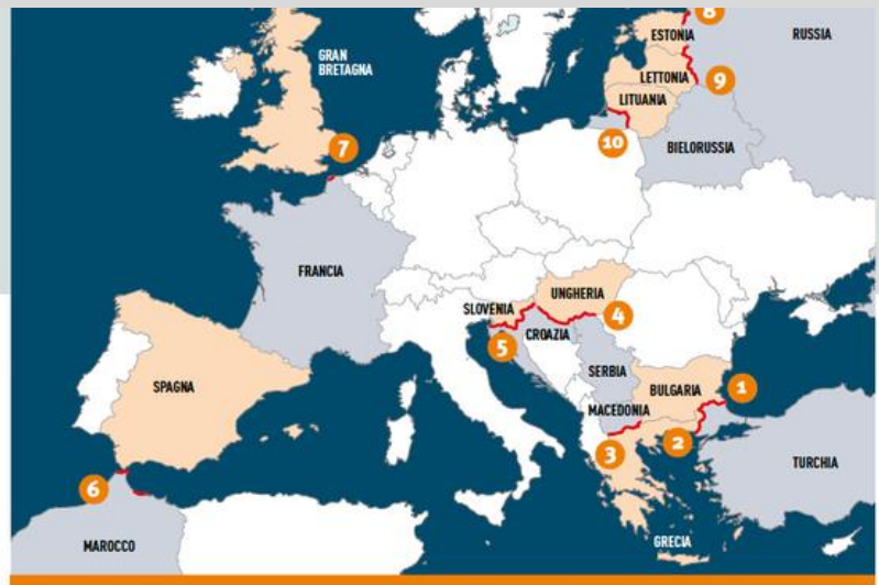
■ Paese che ha costruito il muro ■ Da chi si protegge