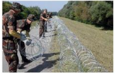
5. Slovenia confine con la Croazia, 198 km