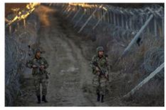
9. Lettonia confine con la Russia, 93 km