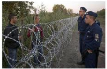
4. Ungheria confine con la Serbia e Croazia, 158 km + 131 km