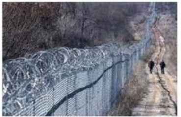
1. Bulgaria confine con la Turchia, 235 km