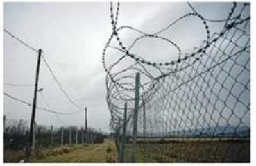
3. Macedonia del nord confine con la Grecia, 37 km