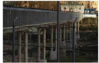
8. Estonia confine con la Russia, 4 km