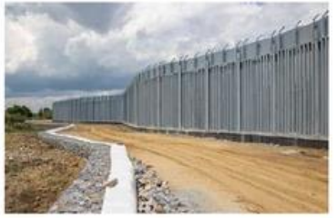
2. Grecia confine con la Turchia, 12,5 km + 27 km