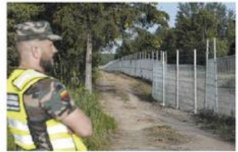
10. Lituania confine con la Russia e Bielorussia, 45 km + 71,5 km