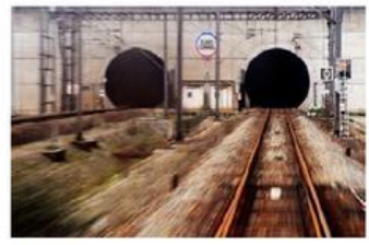
7. Francia EuroTunnel con Regno Unito 1 km